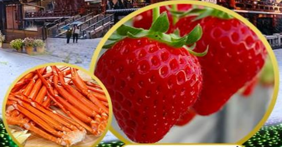
บุฟเฟ่ต์ชาปู