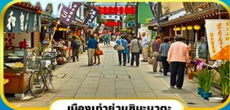
เมืองเก่าย่านฮิบะมาตะ